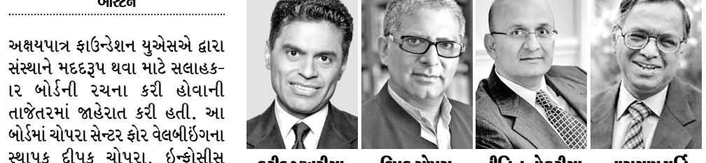
ફરીદ ઝખરીયા, દિપક ચોપરા, નીતિન નોહરીયા, નારાયણ મૂર્તિ

અક્ષયપાત્ર ફાઉન્ડેશન યુએસએ દ્વારા સંસ્થાને મદદરૂપ થવા માટે સલાહકાર બોર્ડની રચના કરી હોવાની તાજેતરમાં જાહેરાત કરી હતી. આ બોર્ડમાં ચોપરા સેન્ટર ફોર વેલબીઈંગના સ્થાપક દીપક ચોપરા, ઈન્ફોર્મેશન ટેકનોલોજીના ચેરમેન અને સ્થાપક એન. આર. નારાયણ મૂર્તિ, હાર્વર્ડ બિઝનેસ સ્કૂલના ડિન નીતિન નોહરીયા, સીએનએનના જીવિસ માટેના હોસ્ટ અને પત્રકાર, લેખક ફરીદ જાબરિયા જોડાયા છે. અક્ષયપાત્ર બોર્ડના અધ્યક્ષ દેશપાંડેએ જણાવ્યું હતું કે જ્યારે સફળ આગવાનો એક સાથે મળીને એકબીજાને પડકાર ફેંકીને સંસ્થાને આગળ લાવવા માટે પ્રેરે છે ત્યારે ચમત્કાર સર્જાય છે. નવરચિત